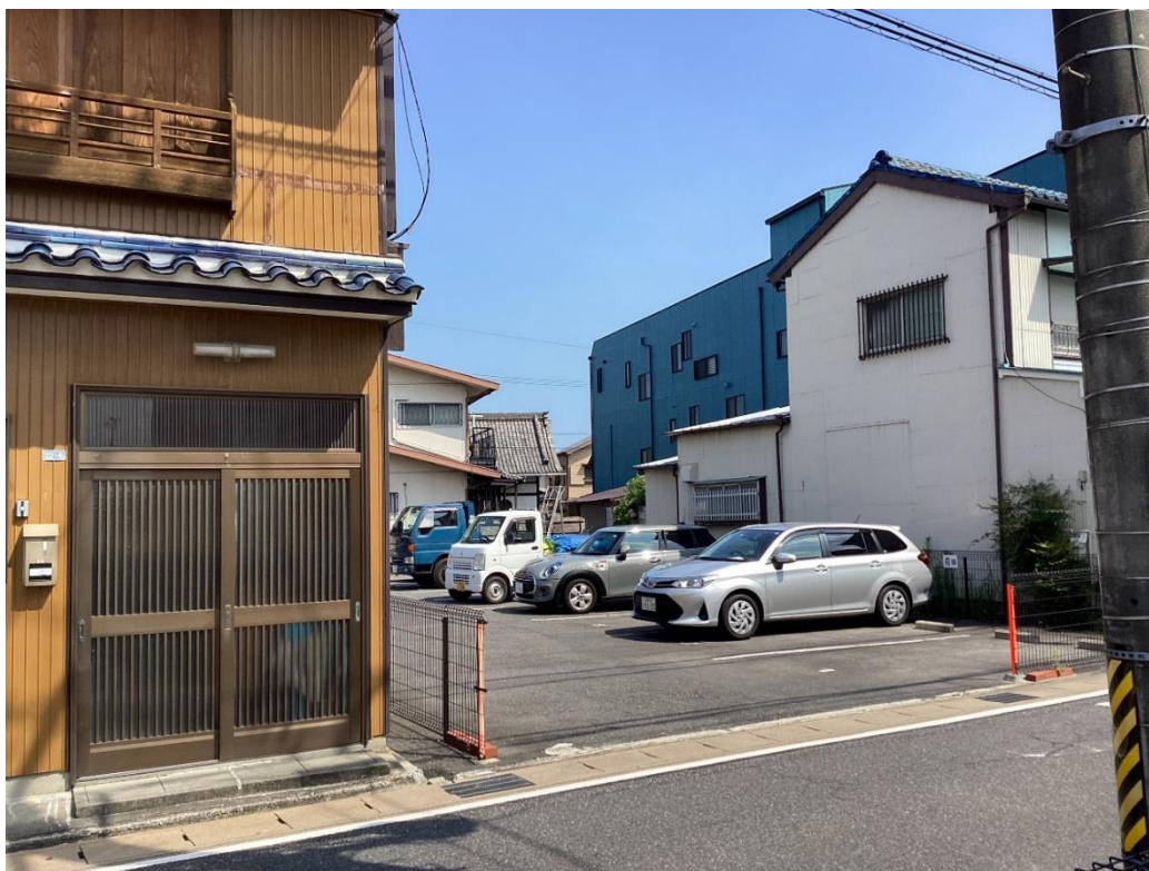
駐車場 (お間違いがないようにお願いします)